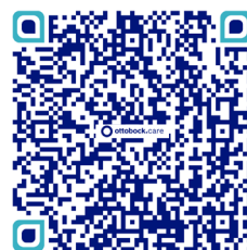
Formulaire PCH (Cerfa n° 15692*01)