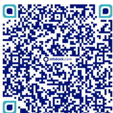
Quels financements pour les aides techniques ?

Un principe clé toutefois : le non-surfinancement. Le cumul des aides ne peut dépasser le coût de l'aide technique.